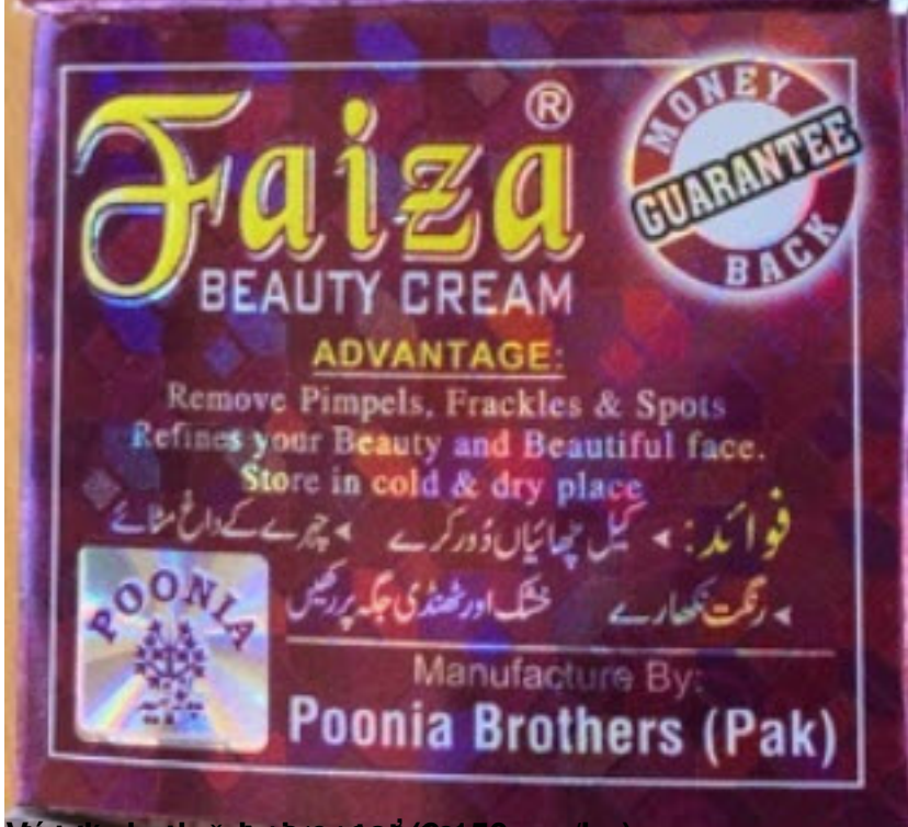
Wytworzone dnia: 09/02/19, Exp: Apr. 2019, Exp. Date: Apr. 2022, výrobok v plastovom obale zabalený