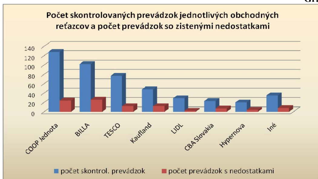
Graf č. 3

Najviac prevádzok supermarketov, hypermarketov a obchodných domov so zistenými nedostatkami bolo v Nitrianskom kraji (21 prevádzok) a v Trnavskom kraji (18 prevádzok). Najmenej prevádzok so zistenými nedostatkami bolo v Košickom kraji (4 prevádzky). Najviac nedostatkov bolo zistených v predajniach BILLA – v 26 zo 102 prekontrolovaných predajní, čo predstavuje 25,5 %, v predajniach Kaufland – v 12 zo 48 prekontrolovaných predajní, čo predstavuje 25 %, v predajniach COOP Jednota – v 24 zo 128 prekontrolovaných predajní, čo predstavuje 18,85 % a v predajniach Tesco – v 12 zo 77 prekontrolovaných predajní, čo predstavuje 15,6 %.